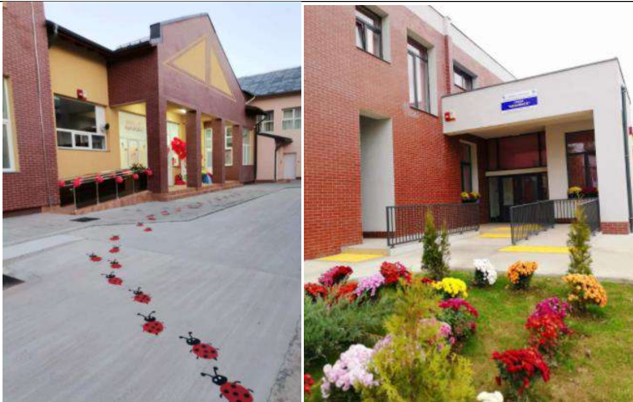
Creșe reabilitate in Municipiul Targoviste

Municipiul Târgoviște deține în acest moment, după derularea în mare măsură a programului amplu de reabilitare, modernizare, dotare și extindere, una dintre cele mai moderne rețele de creșe din România.